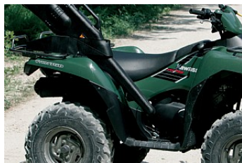
GUN BOOT IV FEGYVERTÁSKA KONZOL 19 177,00 Ft